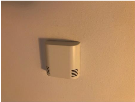
(Lufttermometer - CompWell)

Här kan ni se er lägenhets förbrukning av tappvatten samt el, även er lägenhets lufttemperatur samt den genomsnittliga värmen i lägenheten. Använd vita knappen för att bläddra bland i menyerna.